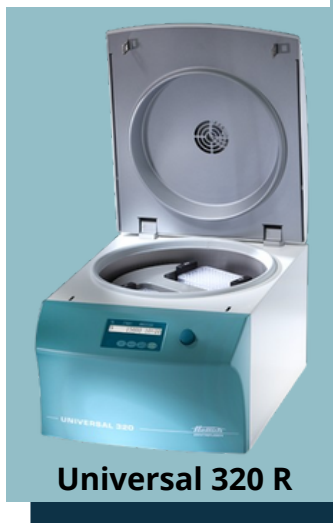
Universal 320 R